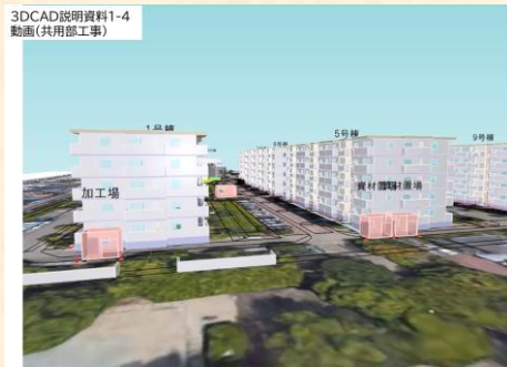
3D CAD 説明資料