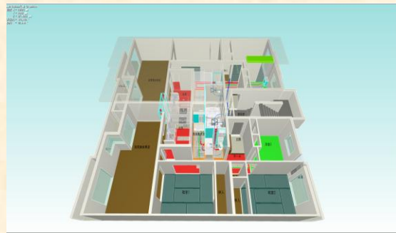
専有部 3D CAD 作成