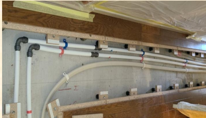
専有部給水、給湯管白色被覆管統一

また、仮設・新設配管のプレハブ化や白色被覆管の統一により、省力化と廃棄物削減を同時に実現しました。スパイダープラスによる完了確認の効率化により、進捗管理と情報共有が円滑になり、施工記録漏れゼロで竣工できました。居住者・管理組合からは、「工事内容が分かりやすく安心できた」「丁寧な説明で納得して進められた」といった評価につながりました。