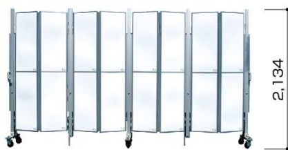
■ サイクルキャスターゲート (CCGA-2036)