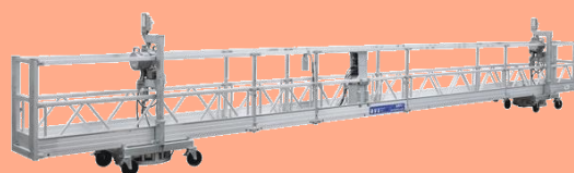
ロングスパンゴンドラ(12m)