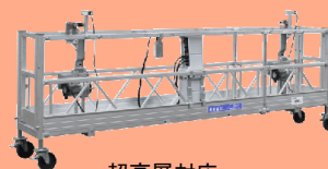
超高層対応 標準デッキ型